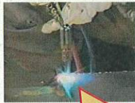
トーチの先端部が塞がる