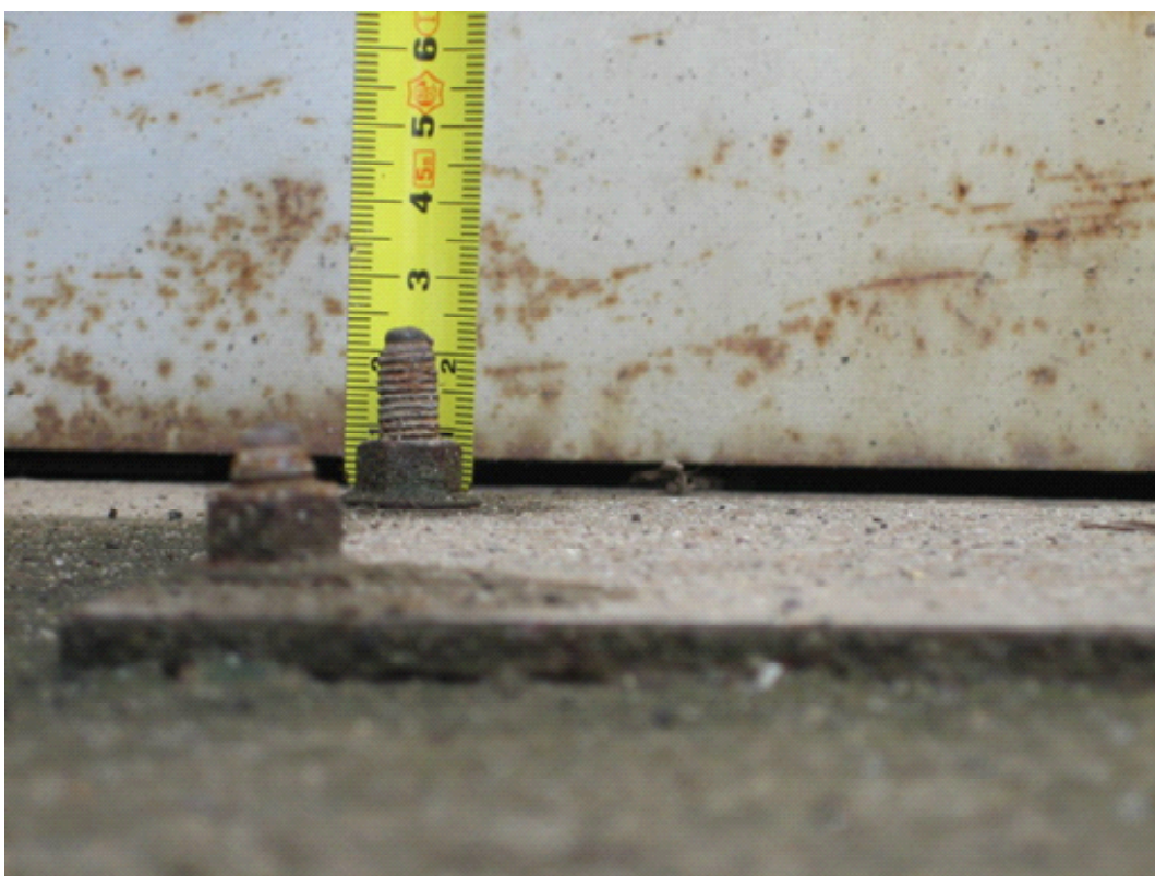
静電気除去板上のボルトの露出部分